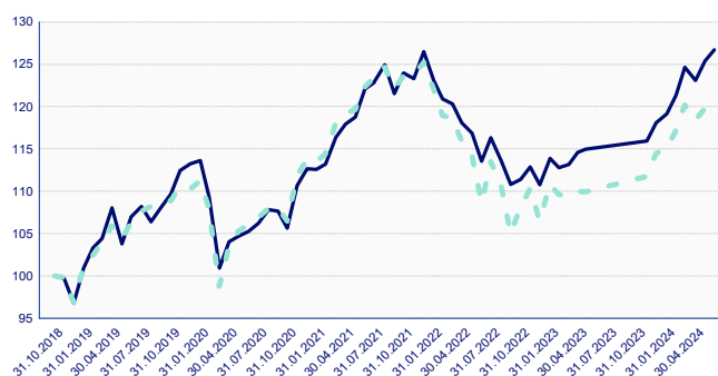
* Le portefeuille de placement LPP Mix Dynamic Allocation 0-80 ne dispose d'aucun benchmark. La confrontation avec l'indice Pictet LPP 40 se fait dans le cadre d'une comparaison simple.